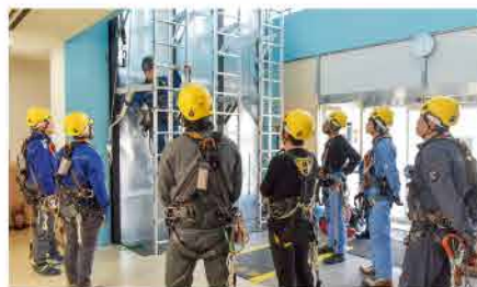
GWO認証訓練 はしご昇降訓練