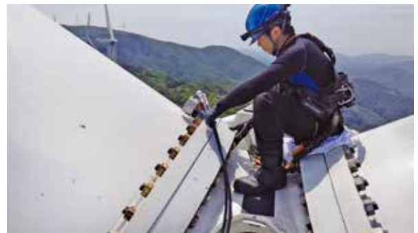
風車ブレードメンテナンス