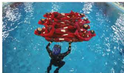
STCW条約訓練 個々の生存技術(カーペット)