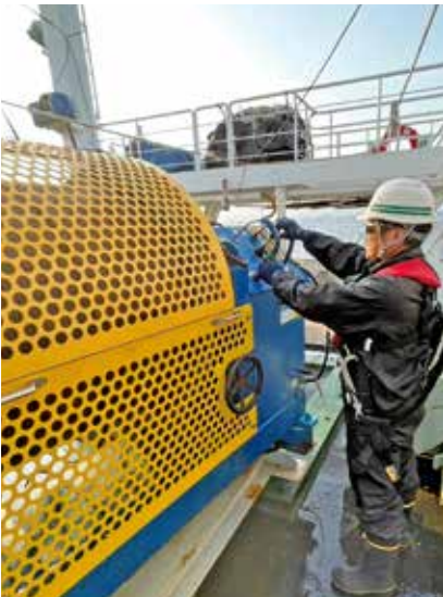
調査機材のウィンチ操作

洋上風力発電に関連の深い環境調査・ケーブル調査等、様々な海洋調査の業務支援をしています。