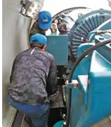
風車ナセル内点検作業中