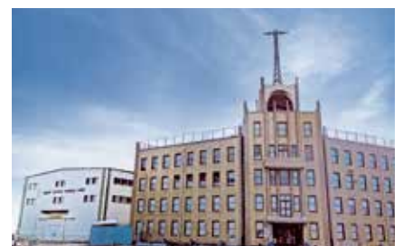
本社入居ビル(右)とNISTC訓練棟(左)