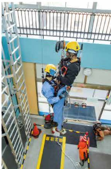
GWO認証訓練 ナセル脱出を想定した緊急降下訓練