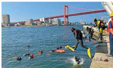
潜水海洋実習 実水域(洞海湾)での潜水訓練