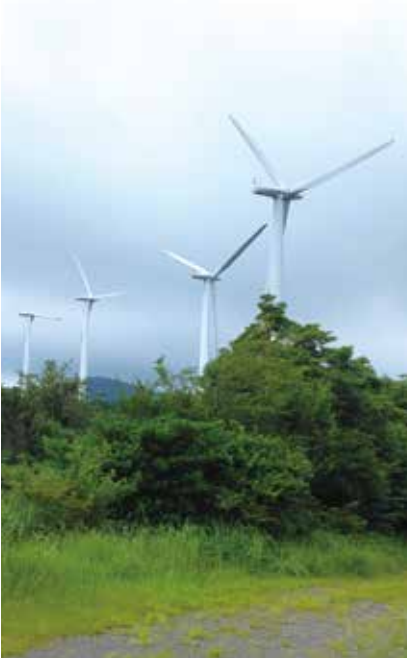
陸上風車点検現場

2050年のカーボンニュートラルの実現に向けて、洋上・陸上風力発電を始めとする「クリーンエネルギー」事業に対し、風力発電施設の据え付け、試運転及びメンテナンスをはじめ、各種業務支援を行うなど、新しい事業にチャレンジしています。