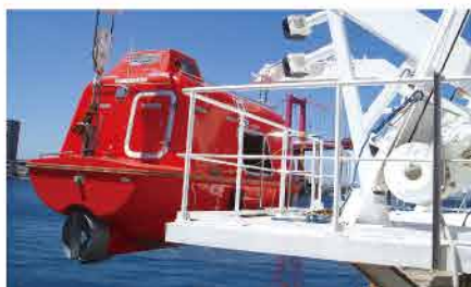
救命艇設備 グアビッド式救命艇