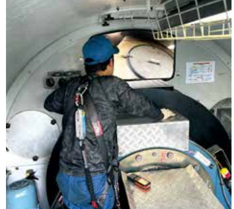
点検後の試運転実施中