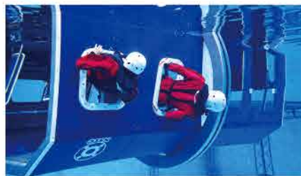
OPITO認証訓練 BOSIET/HUET ヘリコプター脱出訓練