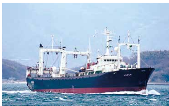
チリ船籍 トロール工船

◎ ニッセイグループ会社の船舶工務等の技術支援及び資機材調達並びに輸出手続き業務を行っています。