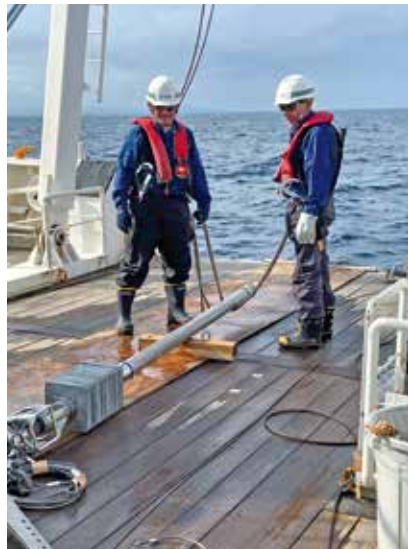
海底の土砂、採取機材の投入