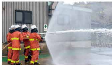
STCW条約訓練 船舶火災を想定した消火訓練